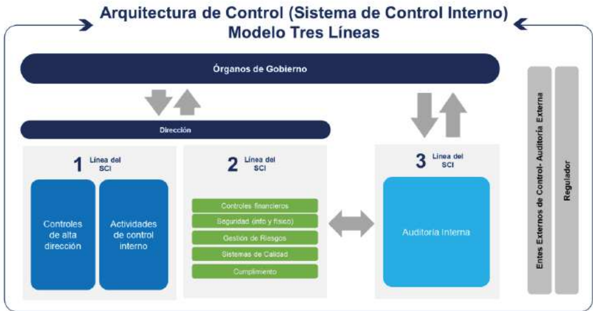
Modelo adaptado del referente impulsado por el ECIIA – European Confederation of Institutes of Internal Auditing y aceptado por el Instituto de Auditores Internos Global

Contugas está comprometido con la adopción de los componentes del Sistema de Control alineados con el modelo “COSO”; así mismo, con aplicar el modelo de Tres Líneas de Defensa, según el estándar impulsado por el European Confederation of Institutes of Internal Auditing (ECIIA), con el cual se definen las responsabilidades frente al Sistema de Control Interno. Con fundamento en lo anterior, Contugas ha adoptado el modelo de las Tres Líneas de Defensa y aplica el siguiente esquema de roles y responsabilidades para gestionar la Arquitectura de Control detallada en la Política de Arquitectura de Control: